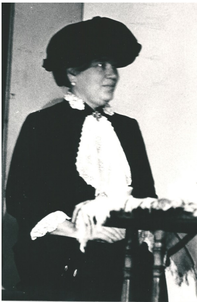
Prostinna i "Bakom Kuopio" i maj 1963